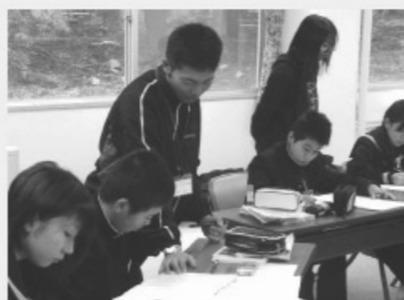
大学生の学習支援も受けて