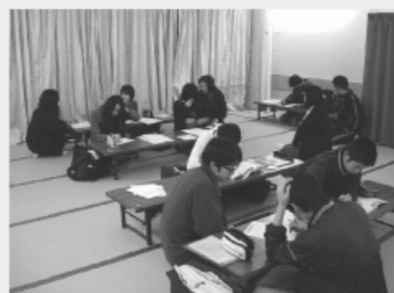
3年生は朝5:30に起きて がんばりました

2学期制の特色をいかして、曾爾中学校では、今年も12月14日(水)～16日(金)の2泊3日で、青少年自然の家に学校を丸ごと移して、学力を鍛える合宿を行いました。