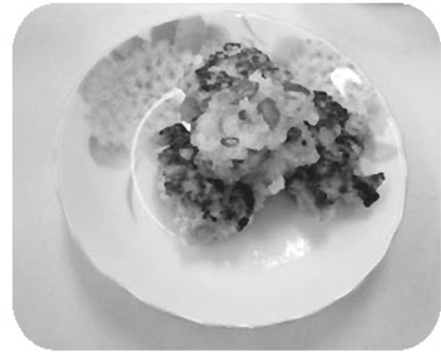
曾爾村食生活改善推進員協議会