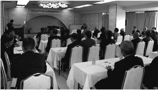
平成24年度宇陀郡・山辺郡議会議員研修会 平成24年10月26日(金)14:00～名張市青蓮寺レークホテル 〈参加者 37名〉