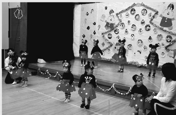
乳児のおともだち