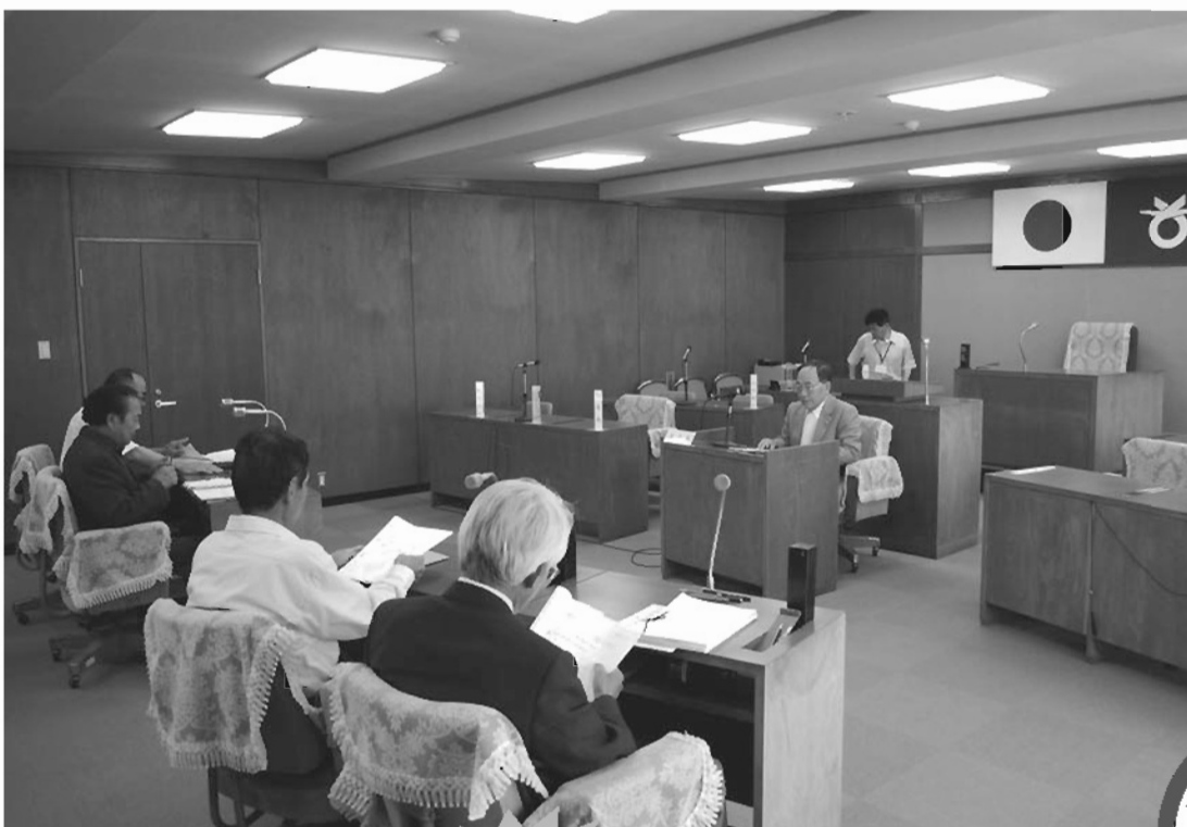
(初めての常任委員会の様子)