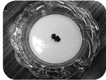
曾爾村食生活改善推進員協議会