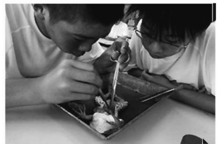
昨年度のサマースクールでの 実験・実習の様子