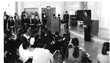
第 56 回へき研大会参加の様子