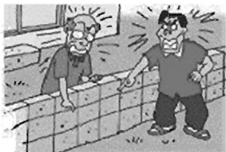
塀を作り替えようとしたら、隣の土地の所有者から「境界が違う」と言われた。