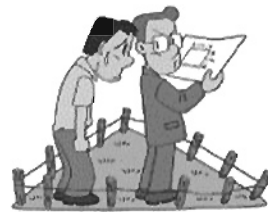
土地を購入し、改めて測ってみたら登記簿の面積と違っていた。