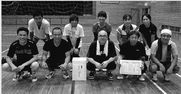
優勝：伊賀見チーム