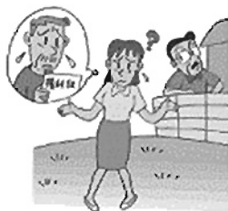
相続を受けた土地の正確な位置がわからなかった。