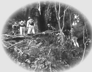
○高井千本杉 別名「七本杉」と呼ばれ、樹齢600年といわれています。井戸杉として植えられ、水が集まるようにしたといっています。今でも1m四方の井戸があります。

右 側 大和茶寮祥伝承地 摩尼山佛隆寺・従是左二軒 真ん中 左室生山道 左 側 右いせみち 左室生山女人高野