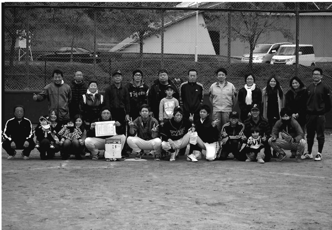
葛チーム 優勝おめでとうございます!