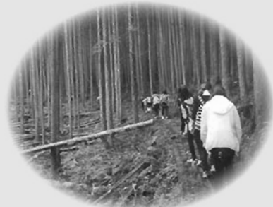
○山粕峠 黒岩の集落から山粕へと続く峠です。 終盤になり疲れもでてきましたが、650mの標高を登りました。