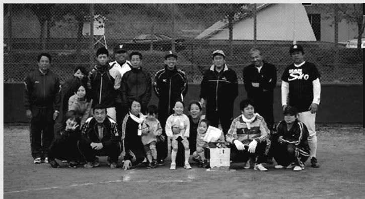
準優勝 山粕チーム