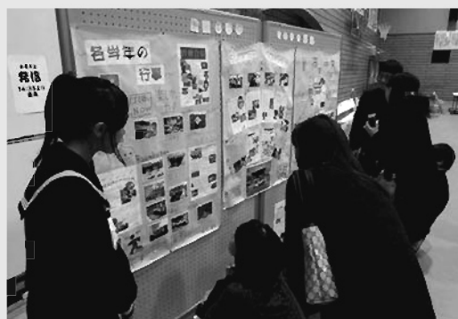
ふるさとタイム「発信」の発表