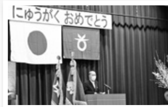
来賓祝辞(芝田村長)