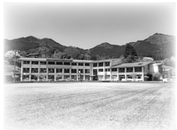
【旧曾爾小学校跡地改修事業】